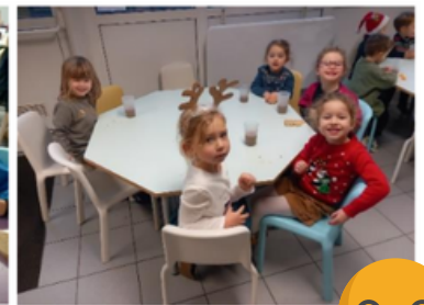
MAT.1 / MAT.2